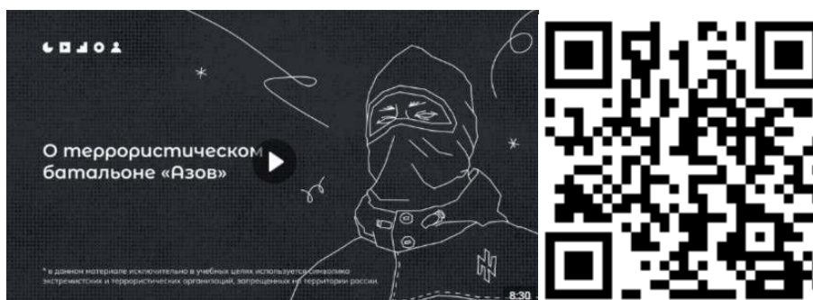
Рисунок 2 – Видеоролик, разъясняющий причины признания организации террористической

3) батальон «Азов» (см. рисунок 2) — военизированное подразделение, созданное в 2014 году на базе футбольных ультрас и праворадикалов Харькова и некоторых других украинских регионов. «Азовцы» причастны к массовым военным преступлениям против мирного населения Донбасса и Украины. Сама организация признана террористической в России по решению Верховного Суда Российской Федерации от 02.08.2022 г. № АКПИ22-411С. Батальон «Азов» входит в состав Национальной гвардии, подчиненной Министерству внутренних дел Украины. С 2014 года боевики батальона «Азов» систематически пытали, убивали и грабили мирных жителей ДНР, ЛНР и востока Украины. У батальона неонацистская идеология. Это проявляется в расизме, русофобии, восхвалении наследия Третьего рейха и украинских коллаборационистов в годы Второй мировой войны. Среди боевиков в том числе распространены радикальные неоязыческие взгляды. Свою идеологию боевики активно распространяют среди украинской молодежи через лагеря подготовки, печатную продукцию (комиксы, книги) и интернет-сообщества. С «Азовом» активно сотрудничает большое количество праворадикальных течений на Украине (признанных в России экстремистскими организациями), например, «Правый сектор», «УНА-УНСО», организация «Тризуб им. Степана Бандеры» и т.д.