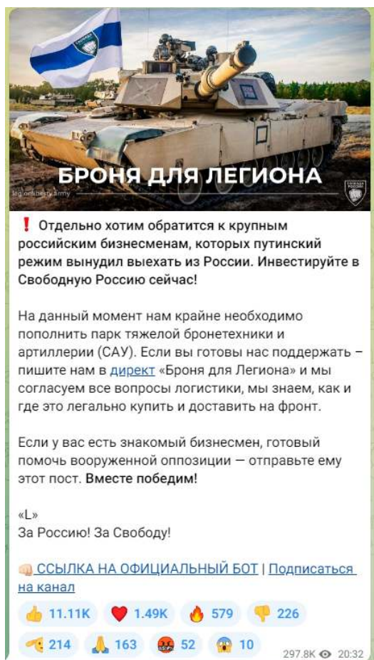
Рисунок 3 — Скриншот телеграм-канала легиона «Свобода России» с призывом к финансированию

Важно подчеркнуть, что помимо собственно пропаганды и распространения идеологии террористических организаций, а также вовлечения в деятельность террористических организаций существует еще одна угроза террористического характера — ложные сообщения о готовящемся террористическом акте. Только за 2021 год зафиксировано более 4,5 тысяч ложных сообщений о готовящихся терактах на объектах социальной инфраструктуры. Это может быть хулиганство, злой умысел, специфическое чувство юмора, желание проверить качество работы правоохранительных органов или антитеррористическую защищенность объекта и др. Во всех вышеперечисленных случаях за такой поступок придется нести уголовную ответственность. Ведь злоумышленник нарушает конструктивную деятельность общественных объектов, а правоохранителям приходится задействовать множество средств и сил, чтобы проверить объекты, которые якобы находятся под угрозой. За ложное сообщение о готовящемся теракте правонарушитель может быть наказан либо штрафами – от 200 тысяч рублей и до двух миллионов рублей, либо лишением свободы – от одного года до 10 лет. Ответственность за данный вид правонарушения наступает с 14 лет (статья 207 УК РФ «Заведомо ложное сообщение о акте терроризма»).