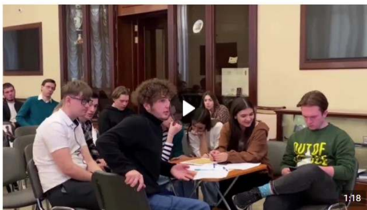
Дебаты «Идеология радикальных организаций» 1 888 просмотров

В рамках дебатов можно: развенчивать мифы, декларируемые представителями радикальных идеологий для вербовки; развивать навыки критического мышления и ведения дискуссии; формировать в целом антитеррористическое сознание и активную гражданскую позицию. Рекомендуется для мероприятия вовлекать не более 20 человек (см. рисунок 5).